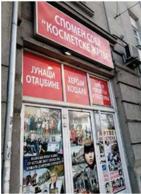
Dhomë përkujtimore "Viktimat e Kosmetit - Trimat e Atdheut" - Beograd (2016)