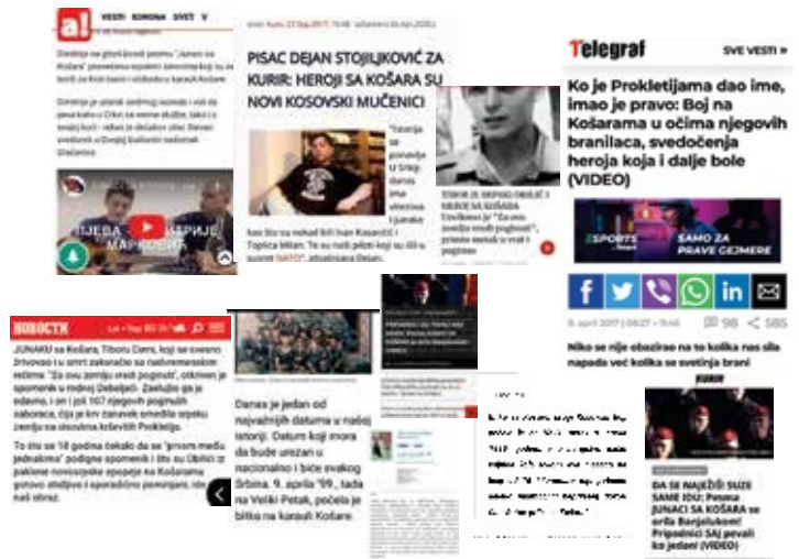
Tekstet mediatike.