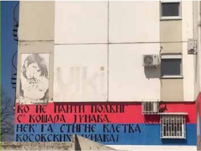
Murali Kush nuk mban mend bëmën e trimave të Koshares, e zëntë mallkimi i trimave të Kosovës - Beograd i Ri.