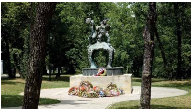
Monumenti i Heronjve të Koshares – Beograd.

Luftimet në Koshare filluan me sulmin e datës 9 prill 1999 kur pjesëtarët e Ushtrisë Çlirimtare të Kosovës (UÇK), të ndihmuar nga Ushtria e Shqipërisë dhe flota aeronautike e NATO-s, kaluan kufirin shtetëror në rajonin e kullës së