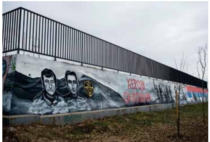
Mural Heronjtë e Koshares – Kralejë (2020).

nga buxheti shtetëror. Të gjitha këto aktivitete shoqërohen edhe nga financimi i projekteve kulturore siç janë projektet botuese, filmat dhe serialet dokumentare dhe artistike, në të cilat investohen mjetet e konsiderueshme publike. Kështu, për shembull, në vitin 2019 u xhirua një serial dokumentar-artistik jashtëzakonisht i shikuar "Tregimet luftarake nga Kosharja" në bashkëproduksionin e Ministrisë së Mbrojtjes dhe Radio Televizionit të Serbisë (RTS) duke paralajmëruar një serial dhe film