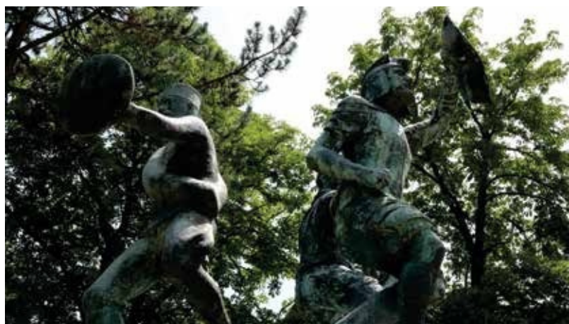
Monumenti i Heronjve të Koshares – Beograd.

vrojtimit dhe sulmuan batalionin e 53-të kufitar të UJ-së.