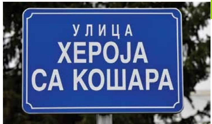
Rruga e Heronjve të Koshares - Novi Sad (2023)