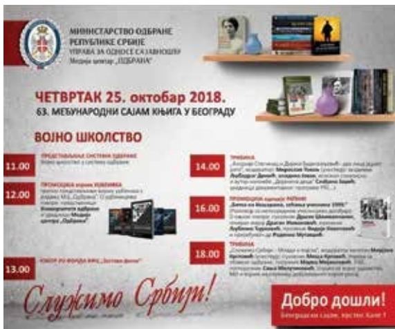
Panairi i Libri 2018: Promovimi i librit "Beteja e Koshares, kujtimet e pjesëmarrësve në 1999" në stendën e Ministrisë së Mbrojtjes së Republikës së Serbisë.