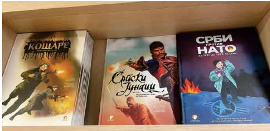
Libra për fëmijë: Koshare - Beteja e re e Kosovës, Trimat serbë - Nga Beteja e Kosovës deri te Kosharja dhe Serbët kundër NATOS nga 1991 deri në 1999 .

organizimin e të gjitha njësive dhe institucioneve të Ministrisë së Mbrojtjes dhe të Ushtrisë së Serbisë.