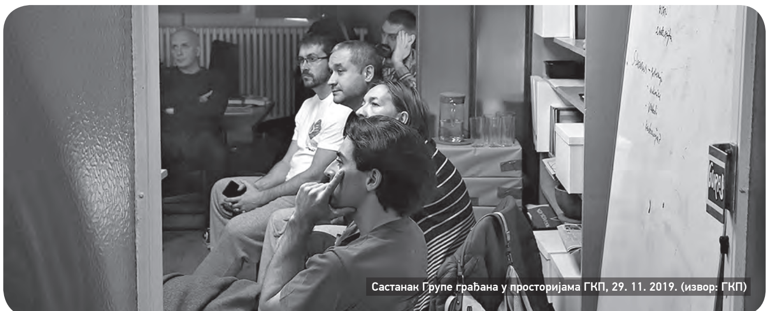
Састанак Групе грађана у просторијама ГКП, 29. 11. 2019.