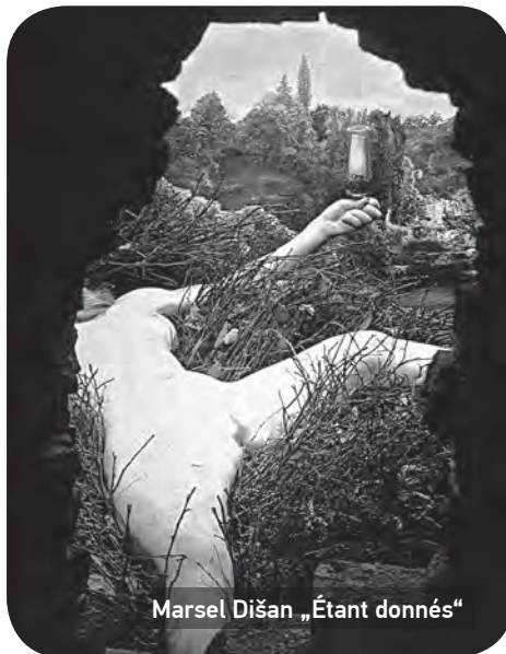
Marsel Dišan „Étant donnés“

Ondašnji pobjednici su bili dovoljno promućurni, možda čak i inteligentni, da nakon početne pobjedničke euforije urba- nističko planiranje prepuste učenim glava- ma pa tako nastaju novi gradski kvartovi projektovani „po meri čoveka“. Limani, a zatim i Novo naselje primer su korektnog planiranja i izgradnje koja u sebi sadrži većinu propratnih sadržaja koji su sta- novnicima ovih kvartova olakšavali i činili život lepim. Masovno ozelenjavanje kao i briga o zelenilu, uz izgradnju mnogobroj- nih osnovnih škola, obdaništa, uz potreban broj prodavnica, faktor su koji i dan danas cenu kvadratnog metra u ovim delovima grada pozicionira na vrh trgovačke liste. Proklamovanu i plansku idilu tog perioda samo povremeno narušavaju manijaci, koji prostitutku podsećaju ko je zaista i koliko je slaba i nezaštićena, zadajući joj udarce