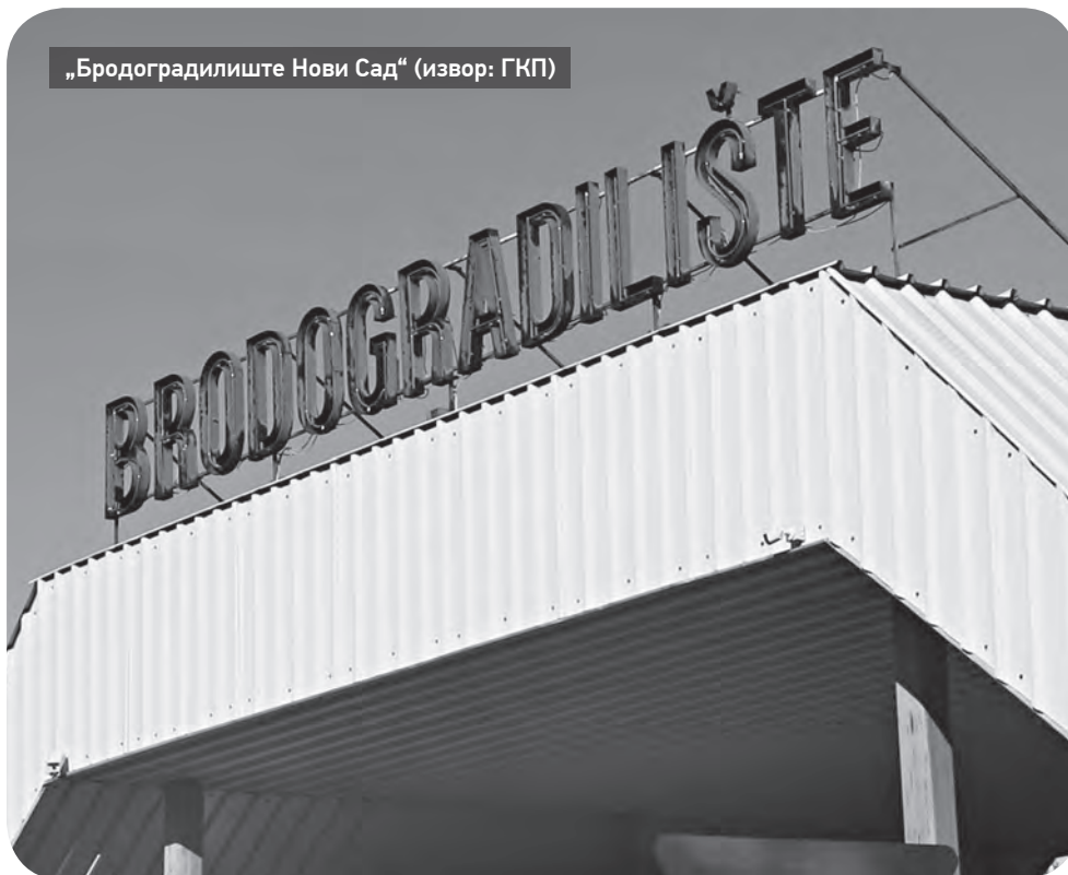
„Бродоградилеште Нови Сад“