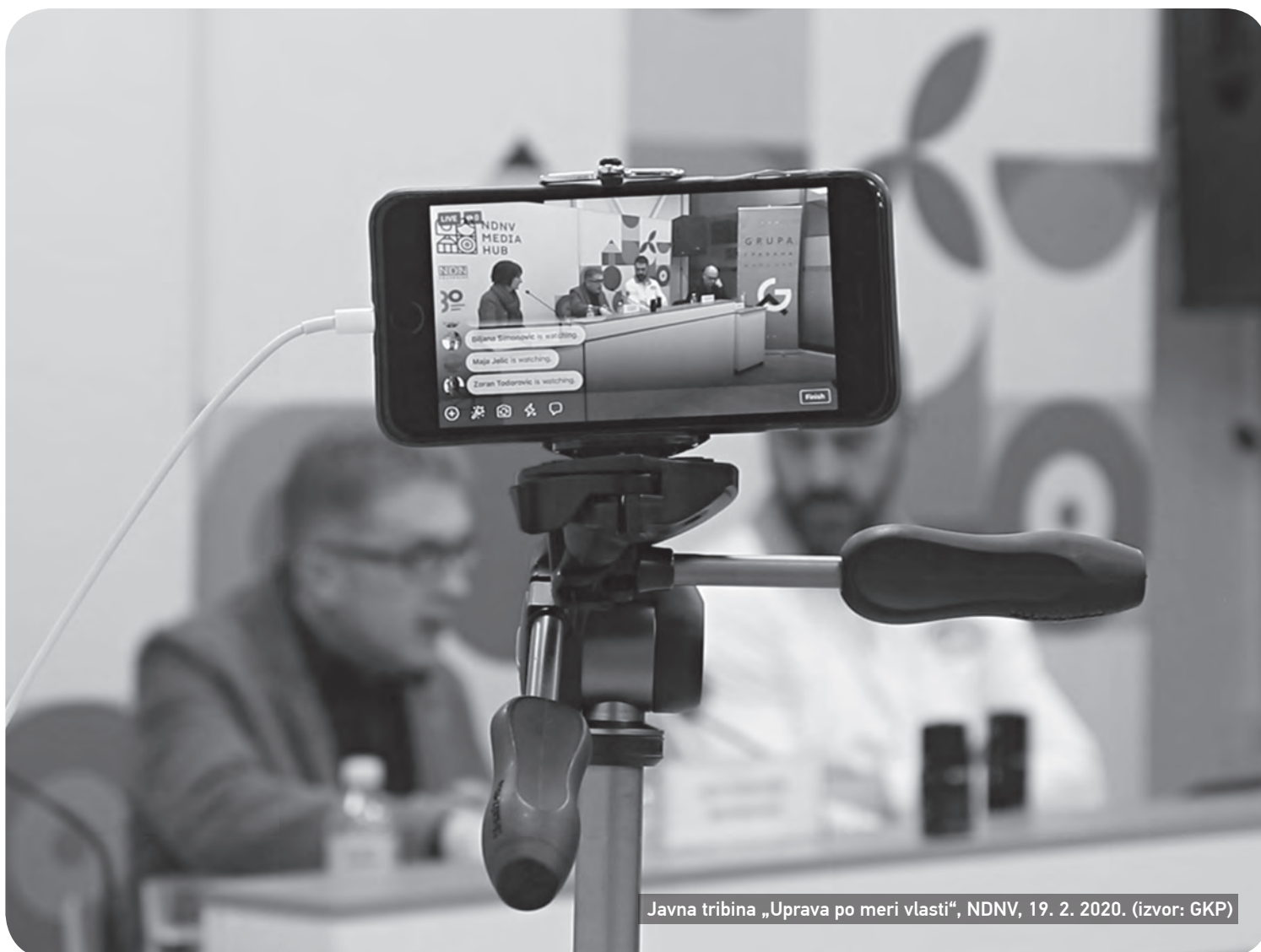
Javna tribina „Uprava po meri vlasti“, NDNV, 19. 2. 2020.