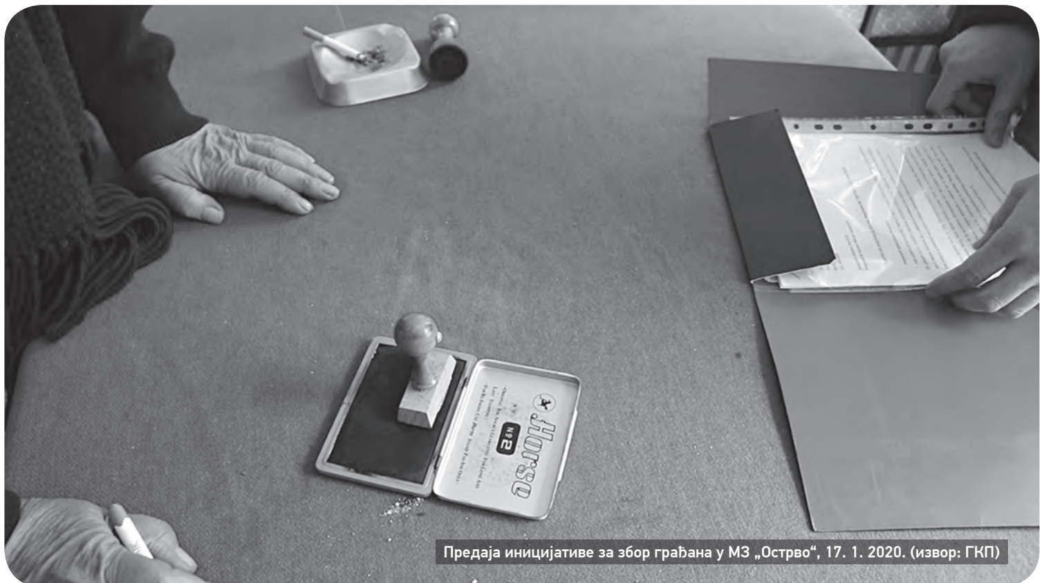
Предаја иницијативе за збор грађана у МЗ „Острво“, 17. 1. 2020.

обзира што Група грађана не намерава да се на њима кандидује. Оно што више није изненађујуће а требало би да буде, је да власт игнорише чињеницу да је за иницијативе за сазивање збора своје потписе дало преко две стотине грађана, јер то нису били потписи за изборну листу. Оно у чему је ова власт једино постојана је систематско игнорисање сваког мишљења и предлога људи које се разликује од њених планова премрежених интересима владајуће партије.