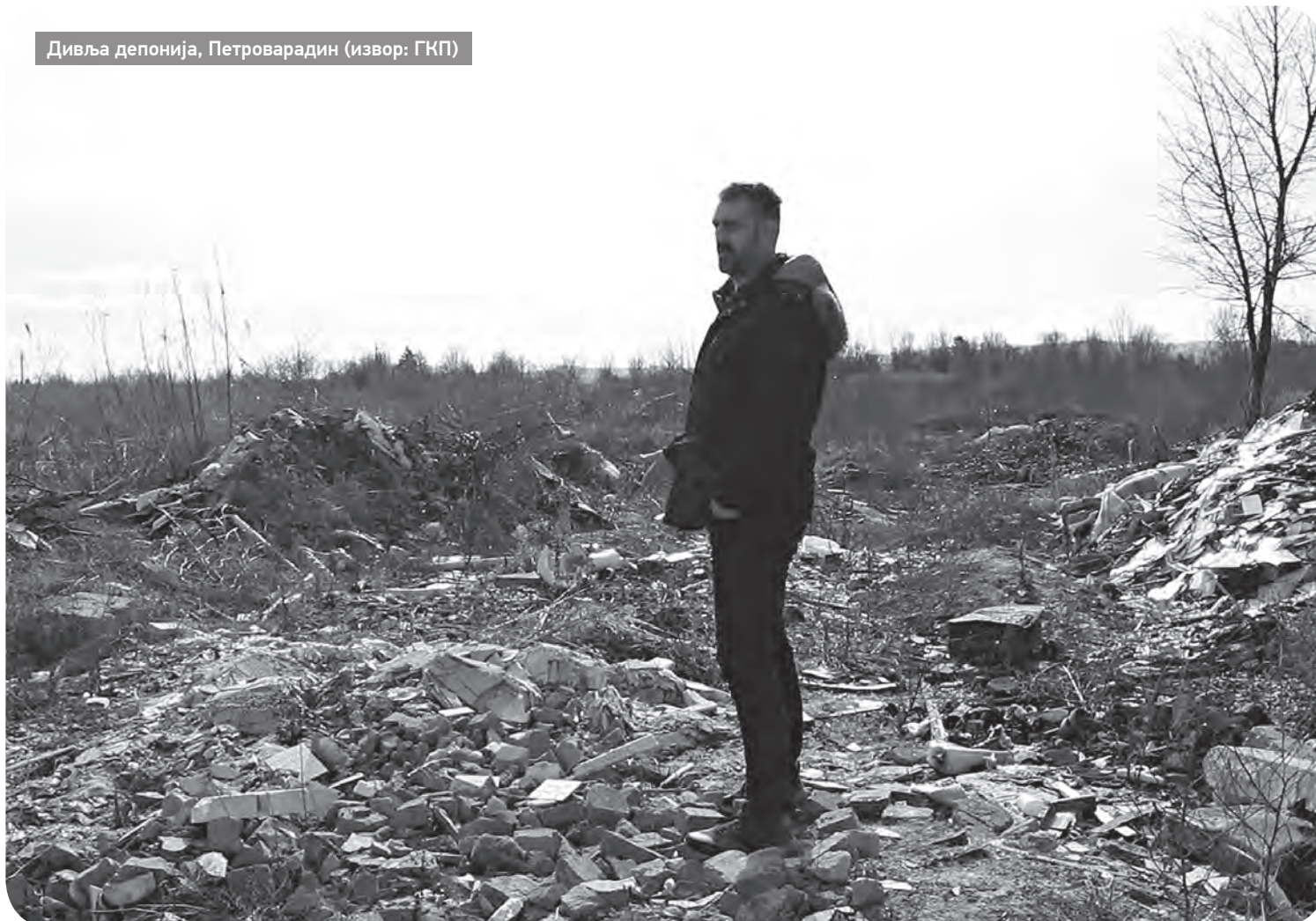
Дивља депонија, Петроварадин