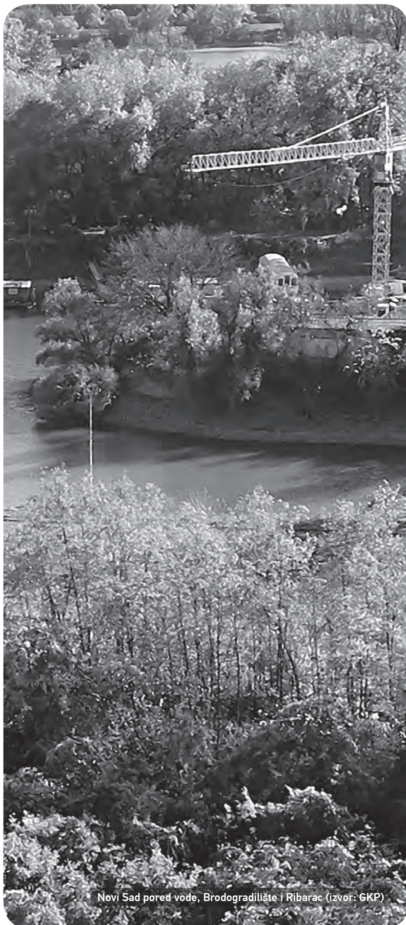
Novi Sad pored vode, Brodogradilište i Ribarac