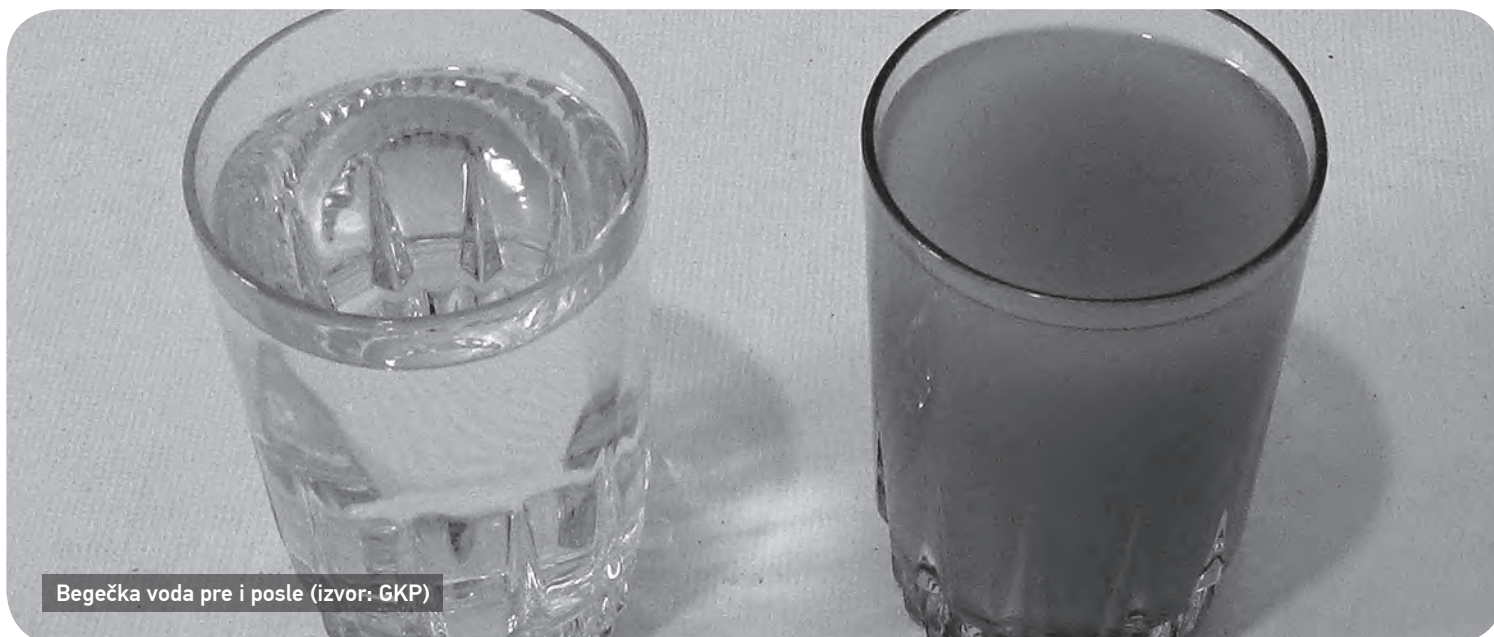
Begečka voda pre i posle