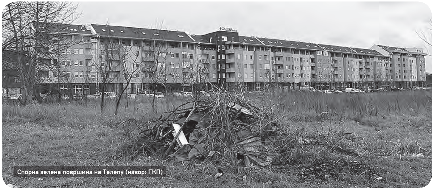
Спорна зелена површина на Телепу

Т елепску иницијативу за одбрану зелених површина покренули смо супруга и ја. Наиме, 2016. године, када смо се преселили на Телеп, закључили смо да у насељу готово да нема зелених површина, а да су чак и оне које постоје углавном неуређене и запуштене. Увидом у градске урбанистичке планове схватили смо да је највећа површина, која је била намењена за парк, пренамењена у Центар за ванредне ситуације, док су преостале две мање зелене површине неуређене или половично уређене, без праћења смерница зацртаних у усвојеним плановима детаљне регулације. Закључак је био једноставан и подударан се са оним што је писало и у Службеном гласнику Новог Сада: зелених површина на Телепу нема довољно а да чак и оне које постоје нису приведене својој намени.