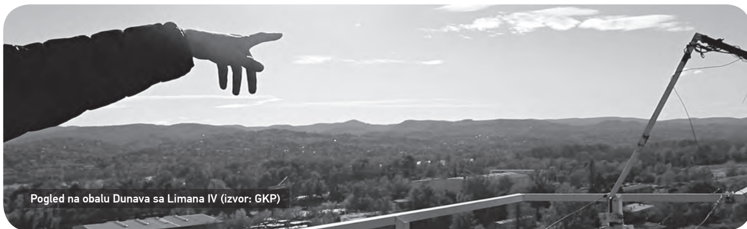
Pogled na obalu Dunava sa Limana IV