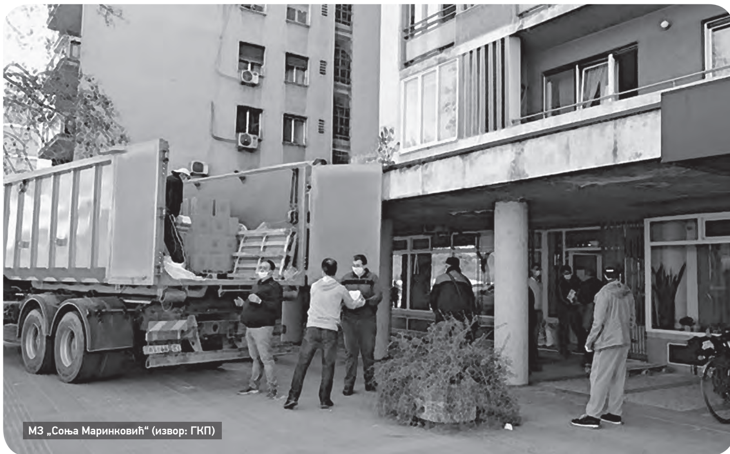
МЗ „Соња Маринковић“

К ако станујемо у ванредном стању? Могло би се рећи тотално, с обзиром да смо уведени мерама у борби против вируса, али и самоизолацијом, усмерени искључиво на ову радњу. Остајемо код куће и станујемо. Наравно, ми који имамо дом. Они који немају, за њих нема ни државних мера заштите у ситуацији епидемије и током ванредног стања, па их надомештају хуманитарне акције самоорганизованих група и организација цивилног друштва у складу са њиховим могућностима. Ни са колективним становањем не иде лако, јер је у изолацији потребно обезбедити снабдевање, посебно за старије станаре којима је забрањено кретање. Станари и управници стамбених заједница морају да брину о њиховим потребама и верујемо да мноштво њих то ради самоиницијативно, схватајући да у овој ситуацији њихова позиција управника има и ту улогу. Такође знамо да и то може бити проблем с обзиром да функцију управника стамбених заједница често преузимају пензионери, дакле старији од 65 година, не само као они који имају више времена на располагању, већ и као они који најбоље знају да је стамбена заједница или скупштина