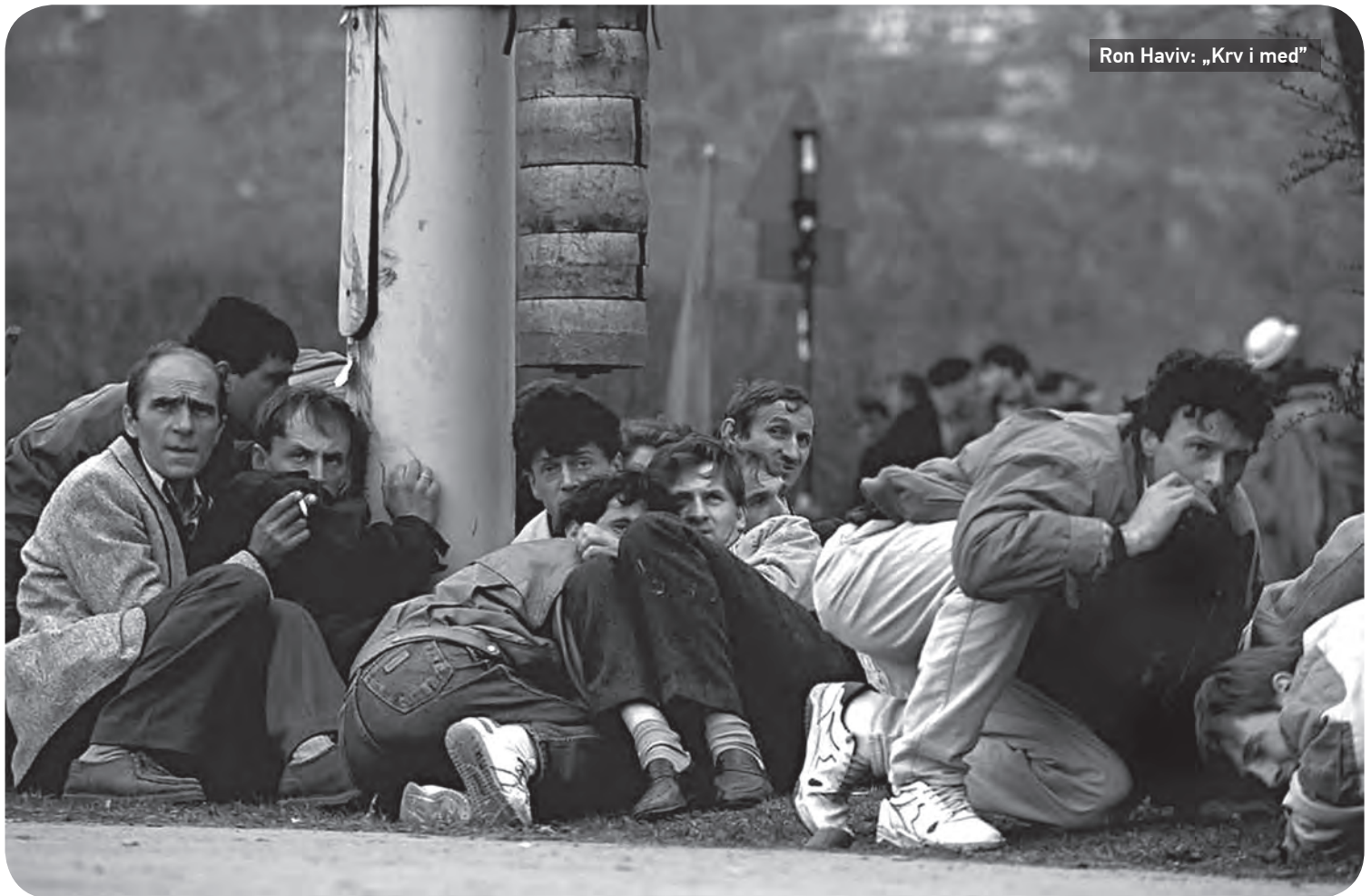
Ron Haviv: „Krv i med”

N aš bojkot nije imao za cilj da bude sredstvo, niti je bojkot, kao politička ideja, trebalo da dovede do poštenih izbora ili boljih izbornih uslova. Bojkot kao ideja je bio misao i jasno izražen stav da izbori u slučaju vlasti kakvu nad nama sprovedi vladajuća koalicija, Srpska napredna stranka i Aleksandar Vučić, više nemaju nikakav značaj. Iako parlamentarna politika nije jedina politika, a vidimo da postoji vreme kada ni ona nije moguća, smisao parlamentarne i izborne politike nije bio značenje ove reči. Ona je od početka predstavljala apel, poziv upućen svima jer se i tiče svih.