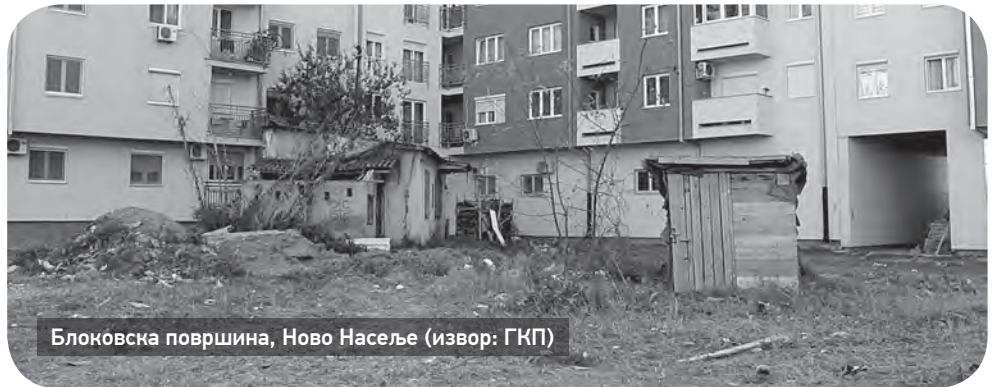
Блоквска површина, Ново Насеље

Тако се дошло до идеје о сазивању збора грађана у Месној заједници „Гаврило Принцип“ на Новом насељу, у којој су планиране све спорне гараже. То је место где би становници могли да чују и изнесу аргументе и донесу свој